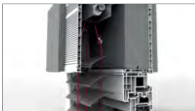
Steuerband und Leiter von Spezialkunstfasern mit Zusatz von Kevlar®