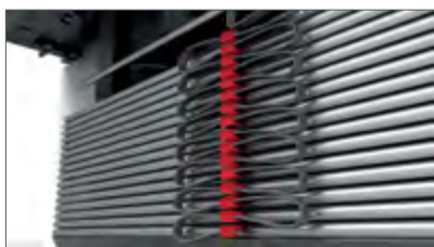
Die Verbindungsweise der Leiter und der Einzella-mellen des Raffstores gewährleistet die optimale Höhe des „Pakets“ der angehobenen Raffstores