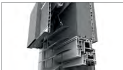
Tiefer Gehäusebox mit Servicezugang von außen (ganze Bebauung möglich)