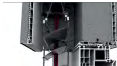
Führungen des Vorhangs der Raffstores aus beständigem Aluminiumguss (Widerstand gegen starken Windböen und hohe Temperaturen)