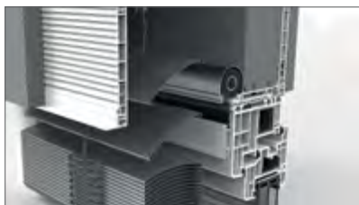
Box mit einem einrollbaren Insektenschutznetz zwischen dem Fenster und dem Vorhang der Raffstores (zusätzlicher Netzschutz)