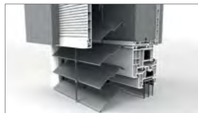
Lamellen der Raffstores in „Z“-Form, die nach dem Schließen des Raffstores einen dichten Panzer bilden (Widerstand gegen das Eindringen von Sonnenlicht)