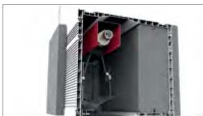
Obere Schiene aus Stahlblech (stabile Verbindung des Pakets mit dem Gehäusebox)