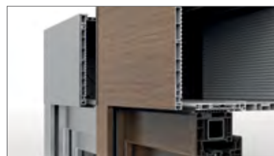
Breite Palette von Ausführungsmöglichkeiten mit Furnier oder Aluminium